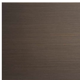
Ottone Brunito Spazzolato a mano