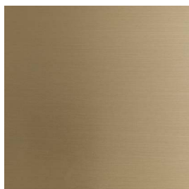
Ottone Naturale Satinato